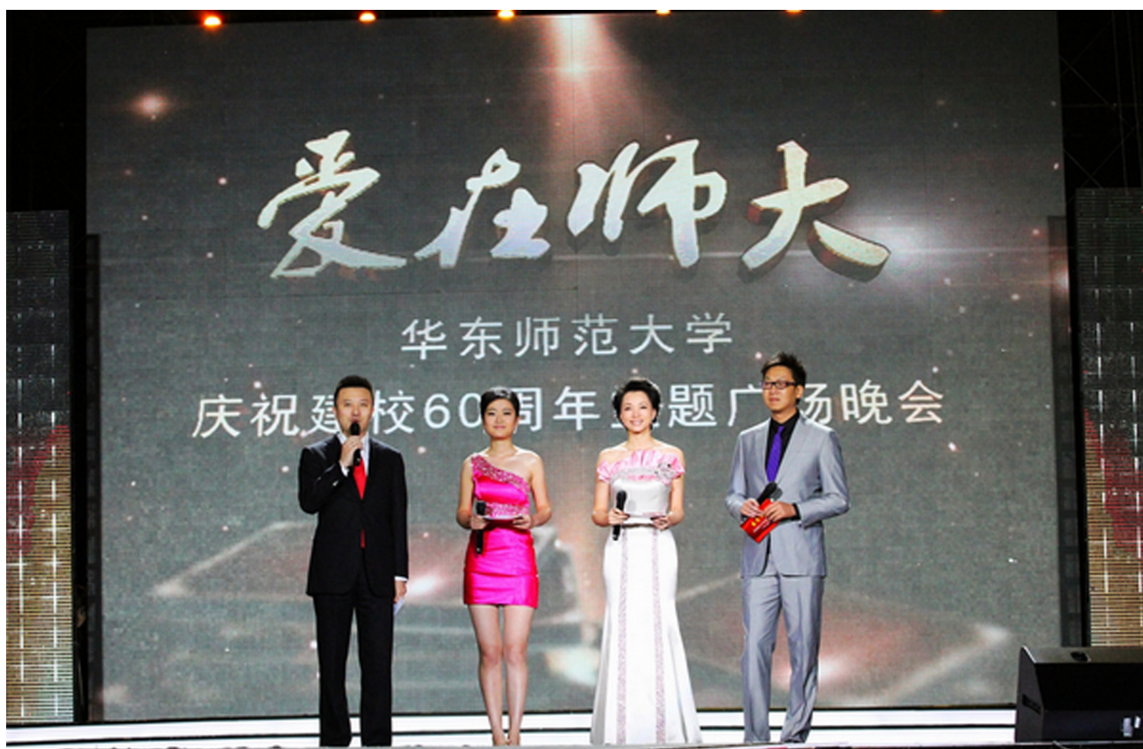
潘涛、陈雪吟、董卿、林海（自左至右）主持晚会